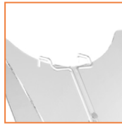
einfaches Einhängen der Fächer