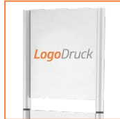
durch Top-Schild personalisierbar