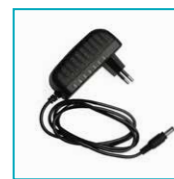
1 Meter Zuleitung