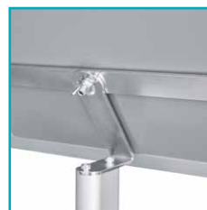
Verschraubung, einfacher Umbau zwischen Hoch- und Querformat