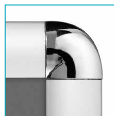
auch mit Rundecken aus chrom erhältlich