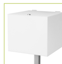
mit weißer Losbox