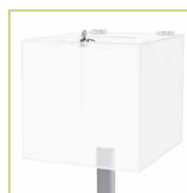
Losbox aus Milchglas