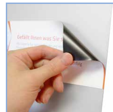
maximale Flexibilität mit Druck auf Magnetfolie