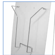
Einhängen der Prospekt- halter über Lochreihen

bedruckbare Fläche B 26 x H 11 cm Infos: S. 8-9