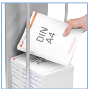
Stauraum für einfache Entnahme