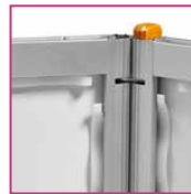
Rückseite des Aluminiumrahmens

Messtheke „Silver-Star“ | gerade ME-THE102 249,90 €