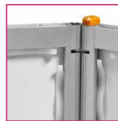
Rückseite des Aluminiumrahmens

Messtheke „Silver-Star“ | gebogen ME-THE103 249,90 €