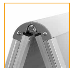
sehr stabile Konstruktion